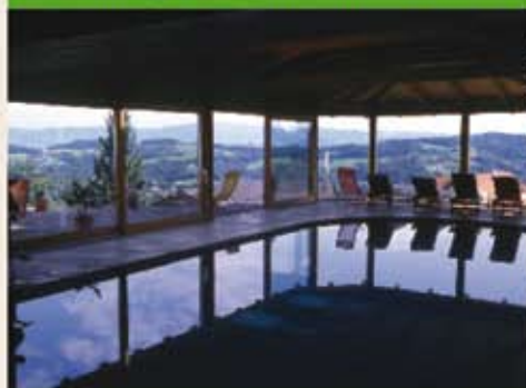
Wellness: Hallenbad, Sauna und Kosmetik