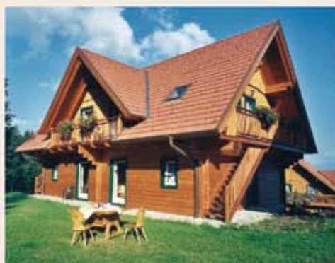
Geräumige Landhaussuiten – beliebt bei Golfern