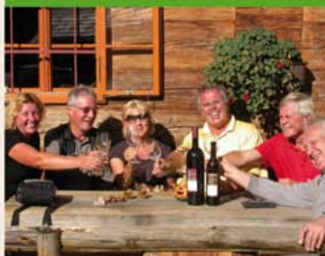
Steirisches Wohlfühlen bei Fahrten ins Weinland