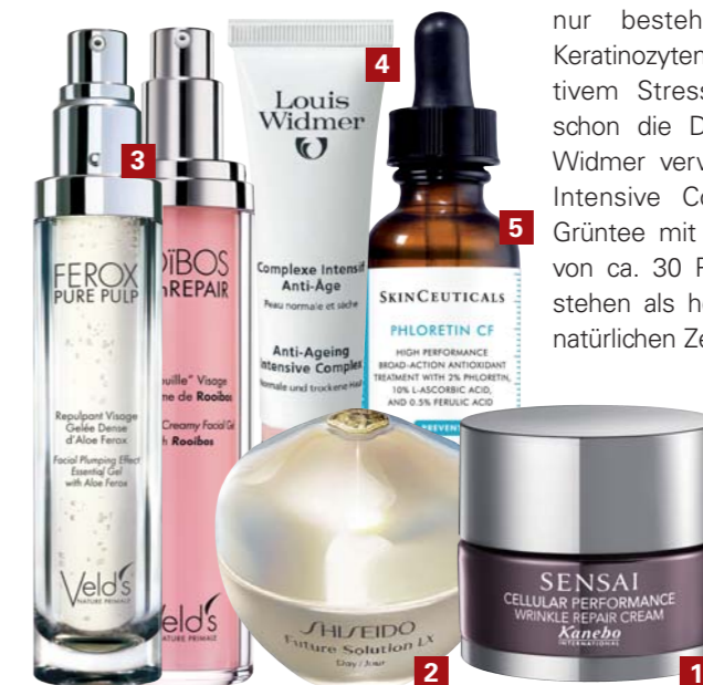
1. Wrinkle Repair von Sensai Cellular Performance 2. Shiseido Future Solution LX 3. Das starke Duo von Veld's, bei Nägele & Strubell 4. Louis Widmer Anti Ageing Intensive Complex 5. SkinCeuticals Serum Phloretin CF

Apropos Oxidation. Dr. Sheldon Pinnell, Vater der Anti-Oxidantien-Technologie und Gründer der Anti-Aging-Premium-Pflege SkinCeuticals, entwickelte ein Serum mit einem Breitband-Antioxidans mit Ferulasäure und dem patentierten Wirkstoff Phloretin aus der Medizin. Es handelt sich dabei um einen leistungsstarken Radikalfänger aus der Gruppe der Flavonoide – sie schützen Pflanzen vor schädlichen äußeren Einflüssen. Dadurch werden nicht nur bestehende Zelltypen wie die Keratinozyten oder Melanozyten vor oxidativem Stress geschützt, sondern auch schon die DNA der Fibroblasten. Louis Widmer verwendet für den Anti Ageing Intensive Complex einen Extrakt aus Grüntee mit einer Catechin-Konzentration von ca. 30 Prozent. Diese Pflanzenstoffe stehen als hochpotente Radikalfänger für natürlichen Zellschutz.